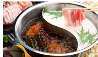
しゃぶしゃぶ食べ放題